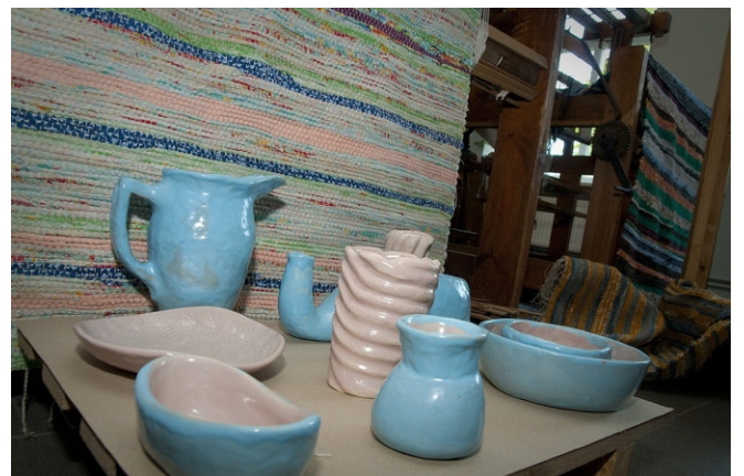
Publikācijas projektam sagatavoja Inga Audere