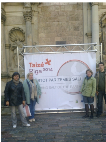
Pie Tezē plakāta pie Rīgas sv. Pētera baznīcas

N o 2014. gada 26. līdz 28. septembrim Rīgā notika Tezē Baltijas reģionālā tikšanās "Kļūstot par zemes sāli".